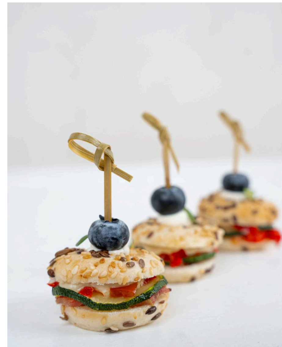
Mini beigelis su daržovių įdaru ir balzamiko actu