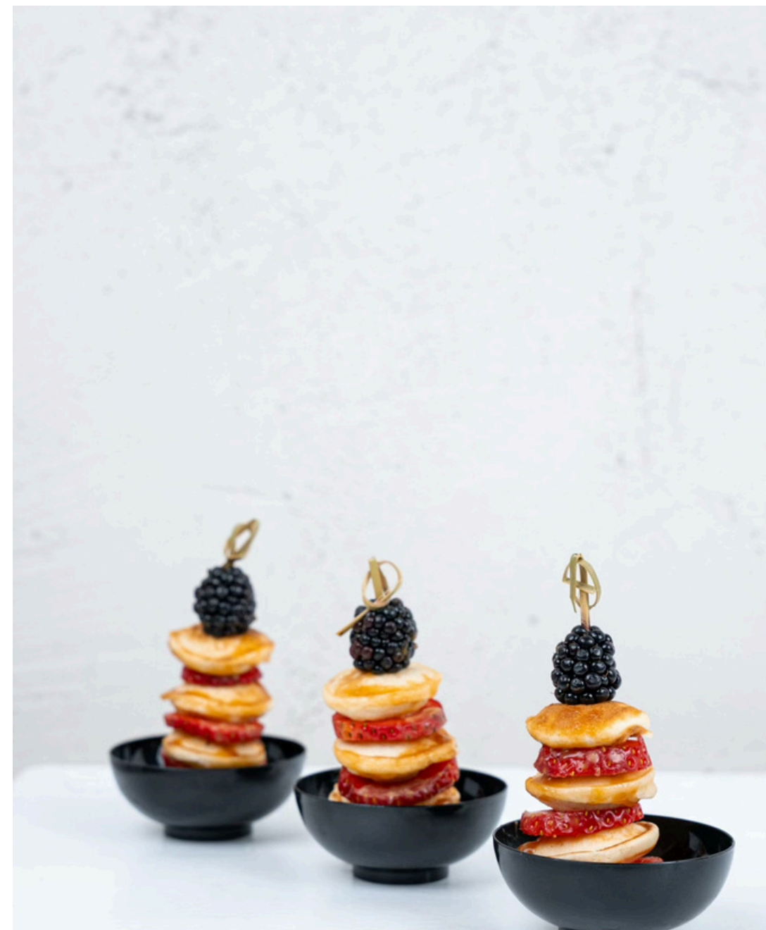
Mini amerikietiškų blynelių bokšteliai su uogomis ir karamele 1 vnt - 1.10 Eur