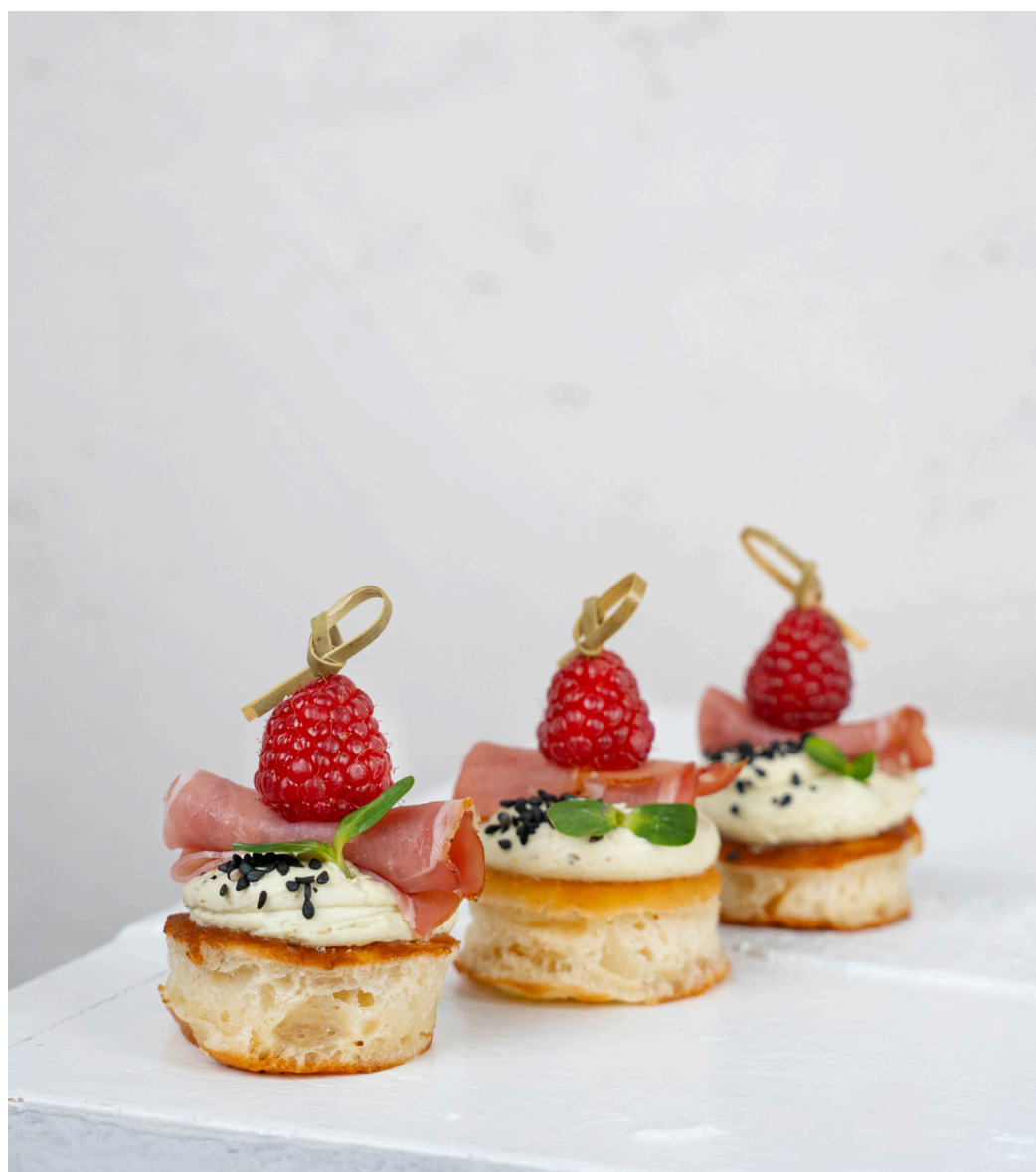
Blynelių užkandis su kreminiu pesto ir kumpiu