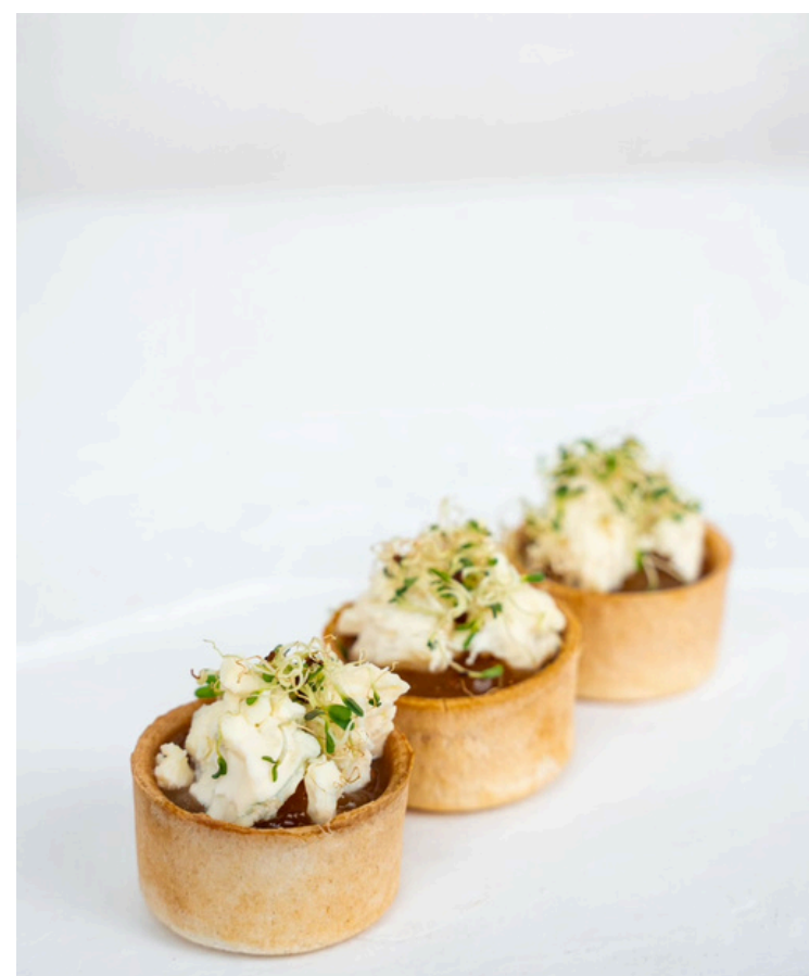
Tartaletė su karamelizuotais svogūnais, figų džemu ir mėlynojo pelėsio sūriu