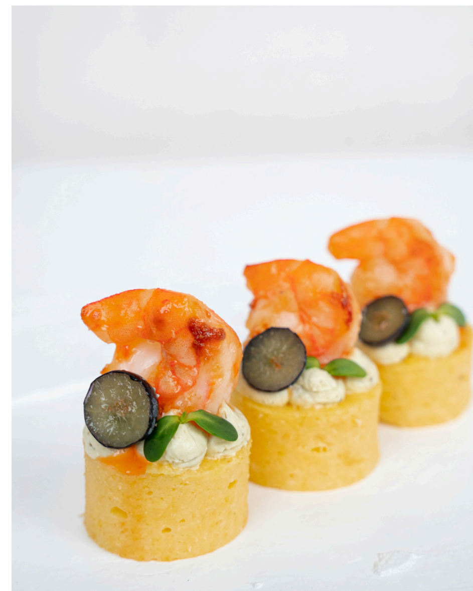
Itališkos polentos ir parmezano užkandis su chilli krevete