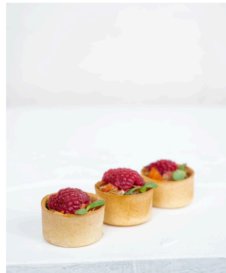
Tartaletė su lašišos tartaru