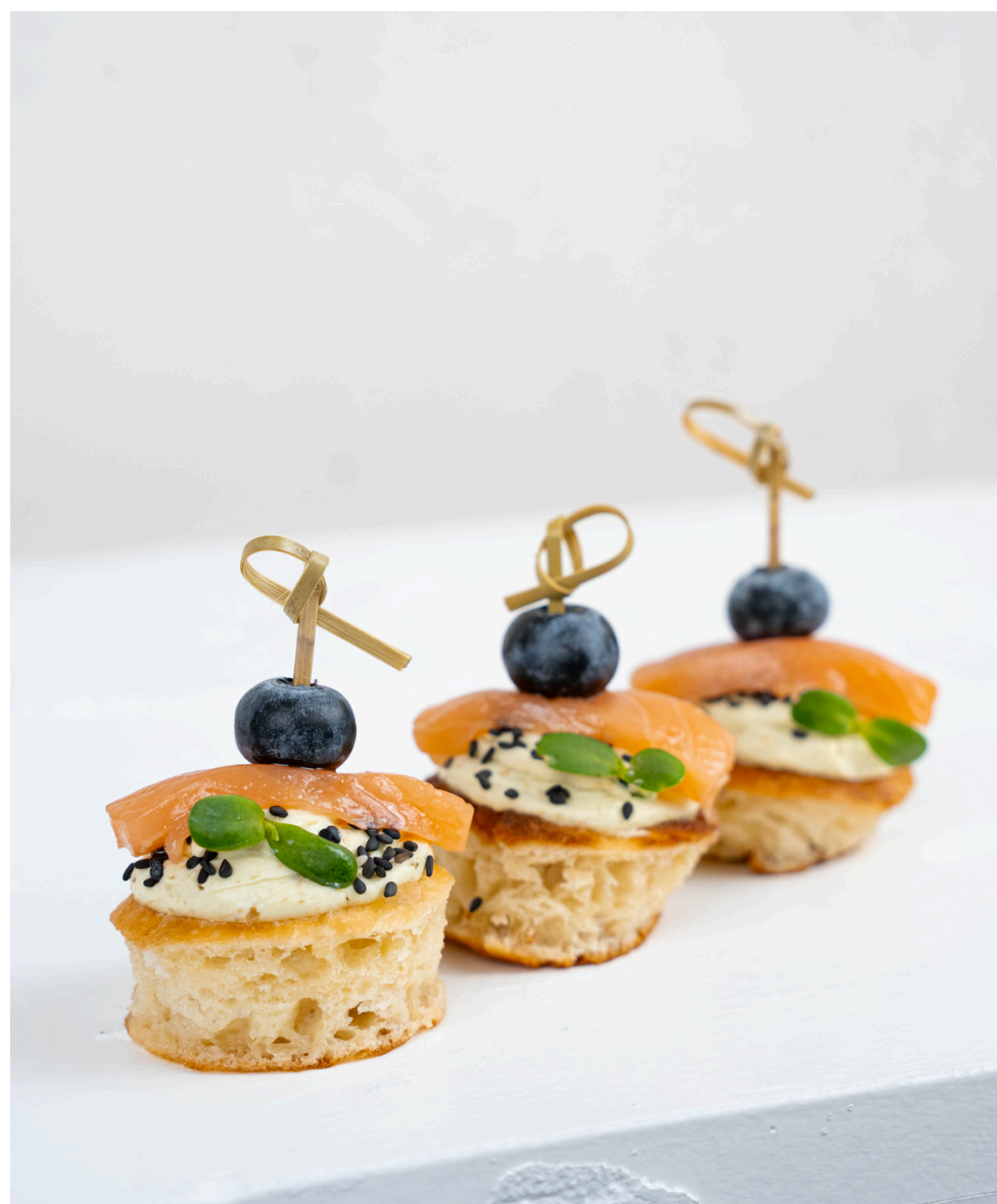
Blynelių užkandis su kreminiu pesto ir lašiša