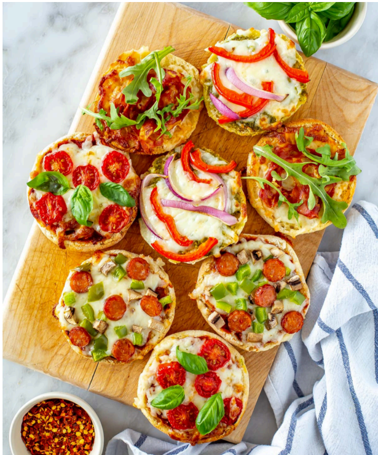
Mini pica su kumpiu ir sūriu