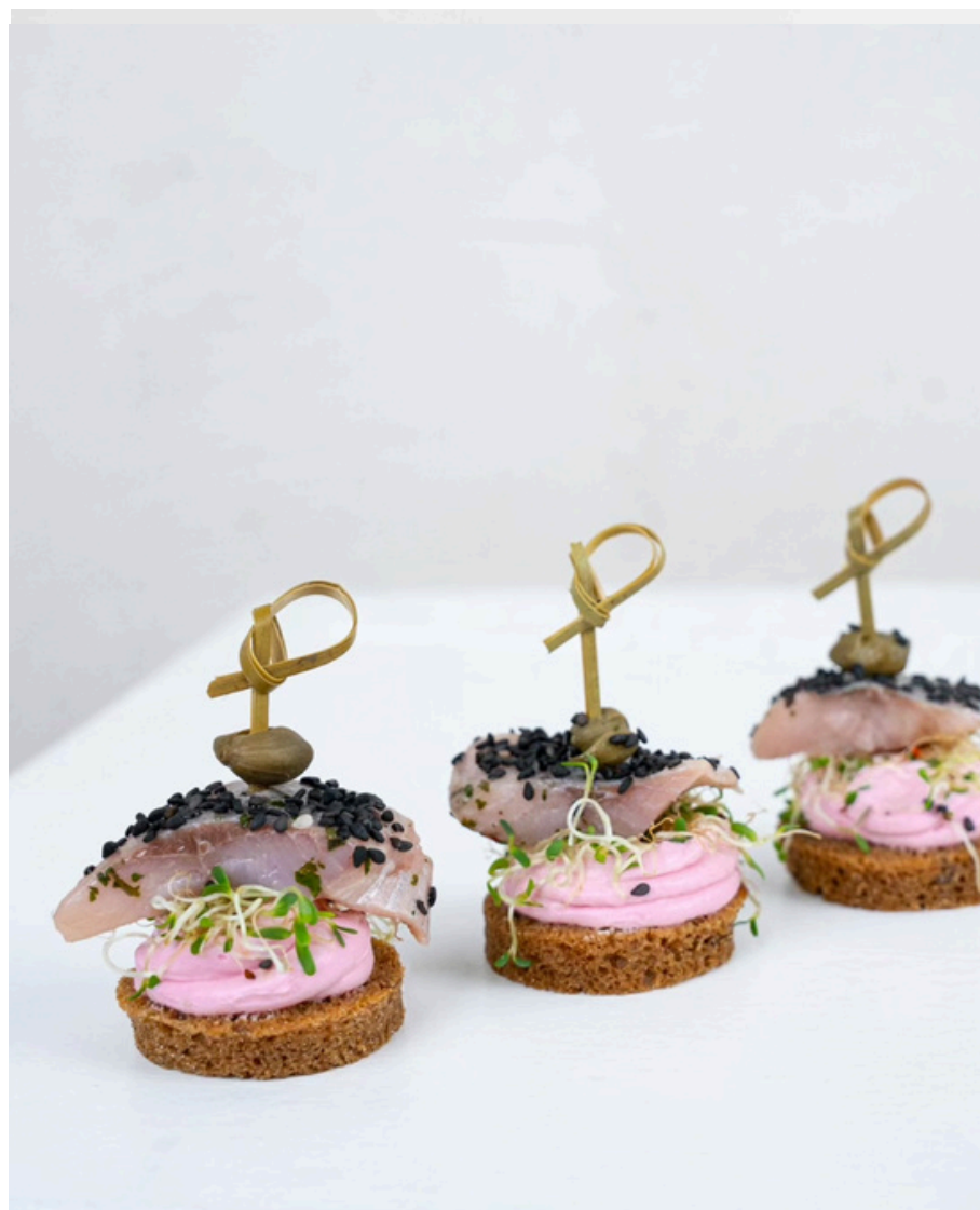
Juodos duonelės užkandis su burokėlių kremu ir silke