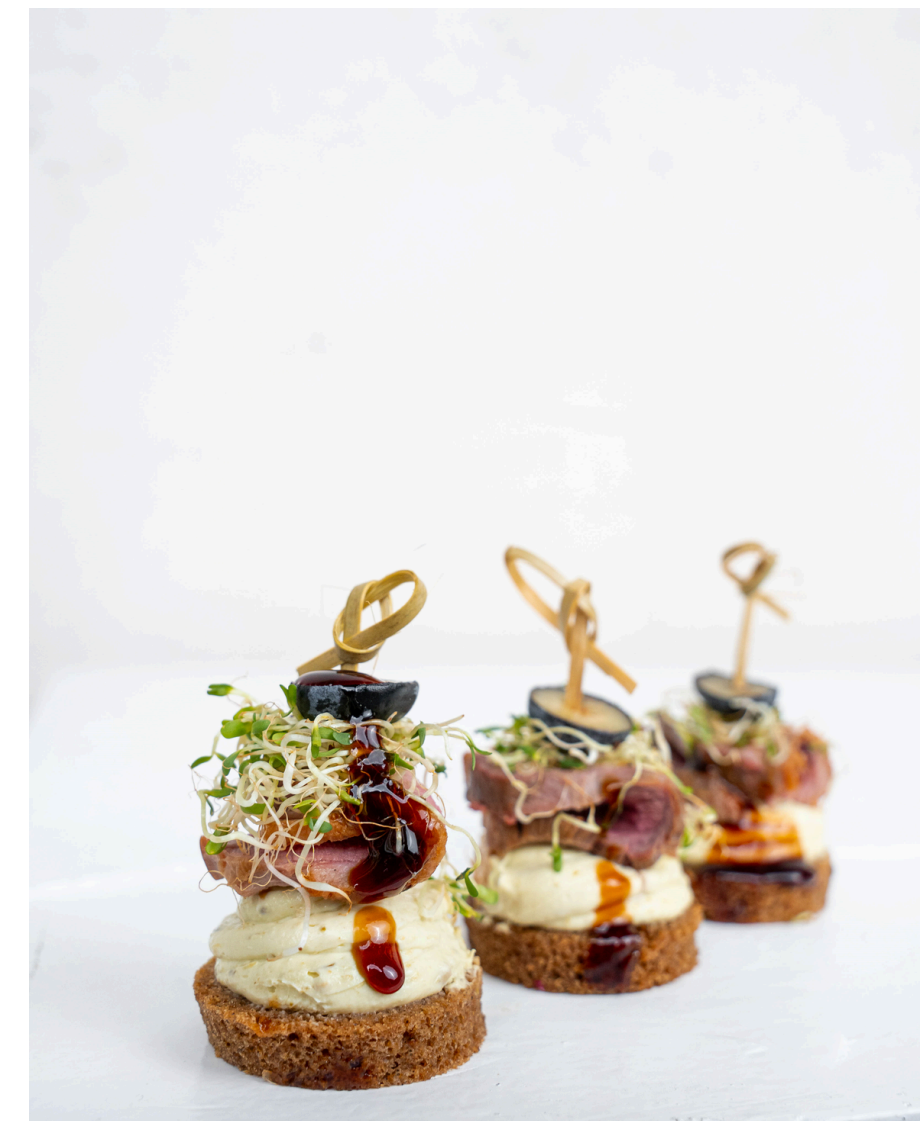
Juodos duonelės užkandis su anties krūtinėle ir balzaminiu acto kremu