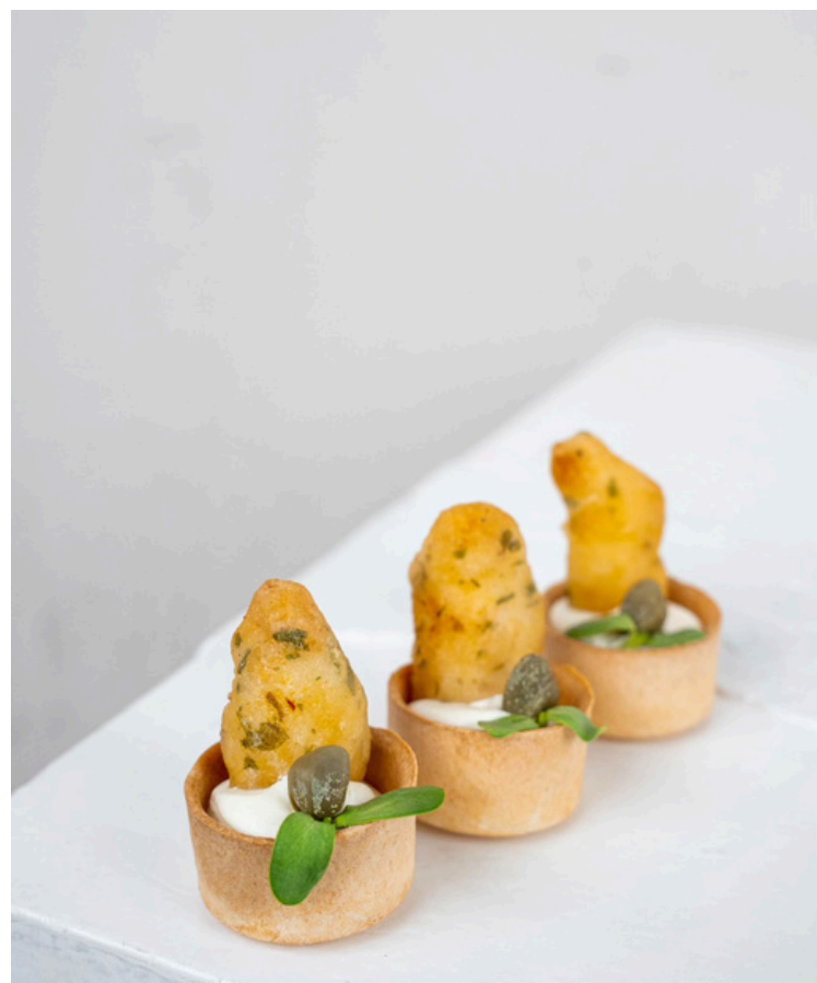
Tartaletė su citrusiniu pesto kremu ir menke