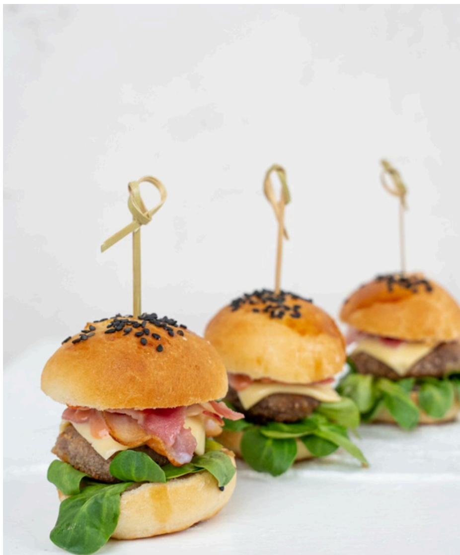
MINI burgeris su jautienos maltinuku, šoninės traškučiu ir karamelizuotais svogūnais 16 vnt - 28 Eurai