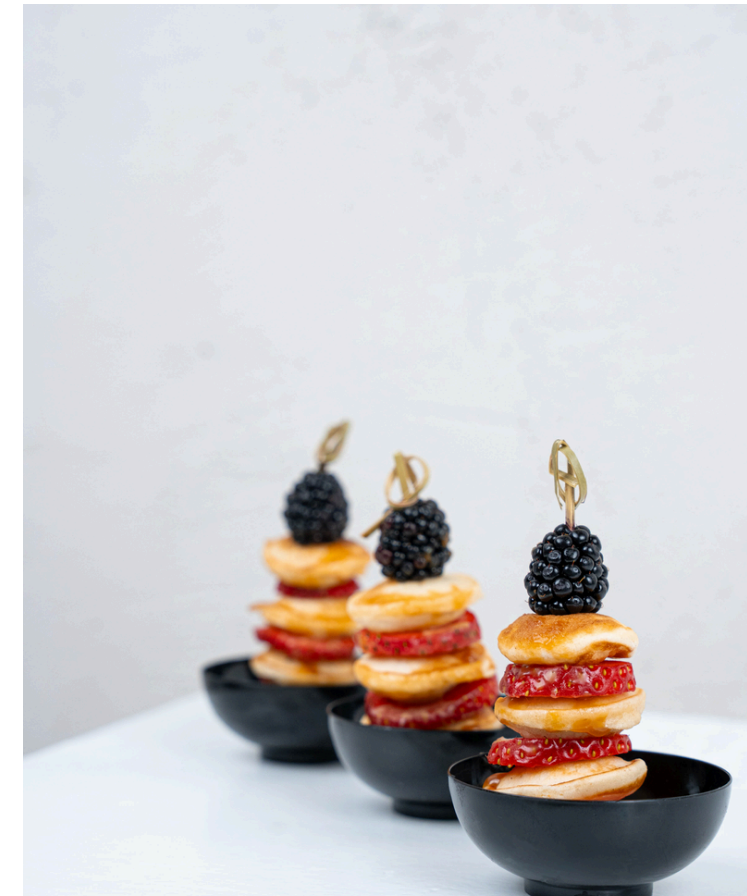
Amerikietiškų blynelių bokšteliai su karamele ir uogomis