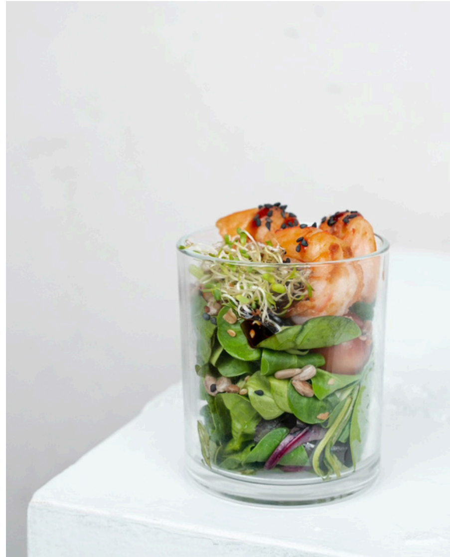
Šviežių daržovių salotos su grill krevetėmis, pagardinta bazilikų padažu