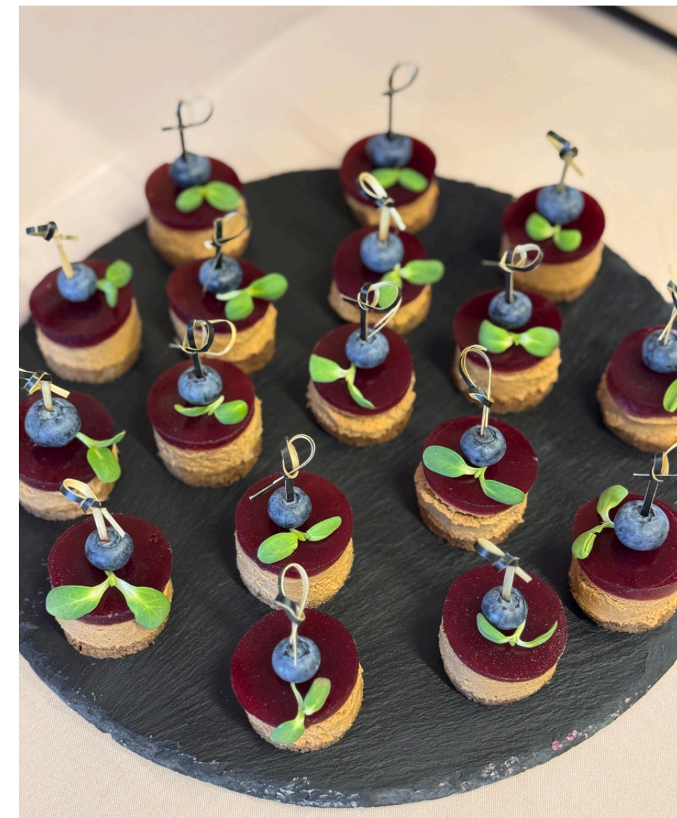
Juodos duonelės užkandis su vištienos paštetu ir spanguolių žele 20 vnt - 30 eur