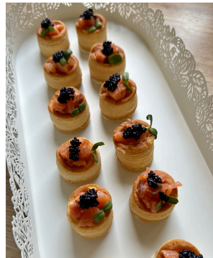
Tartaletė su lašiša ir ikrais