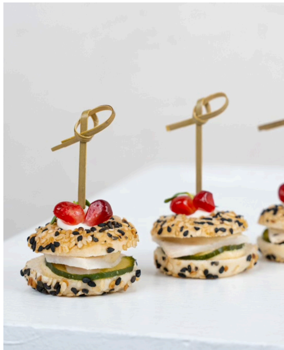
Mini beigelis su rūkytos vištienos kumpeliu ir agurkais