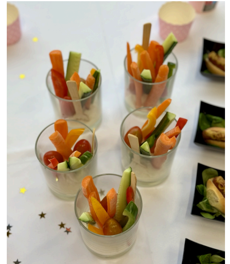
Daržovių juostelės su graikiško jogurto ir sūrio kremu