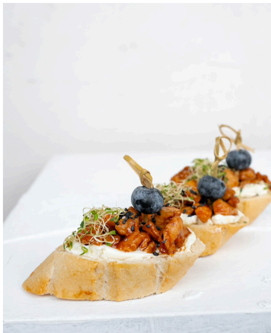
Brusketa su teriyaki vištiena