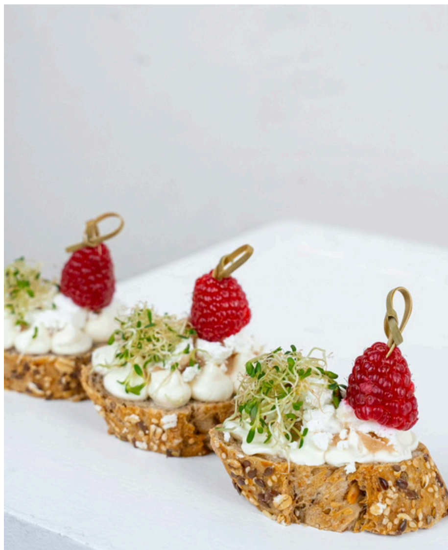
Brusketa su karamelizuotais svogūnais ir ožkos sūriu