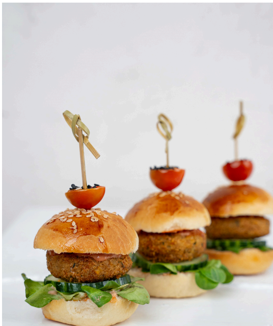
Mini burgeris su avinžirnių maltinuku, salotomis ir čederio sūriu