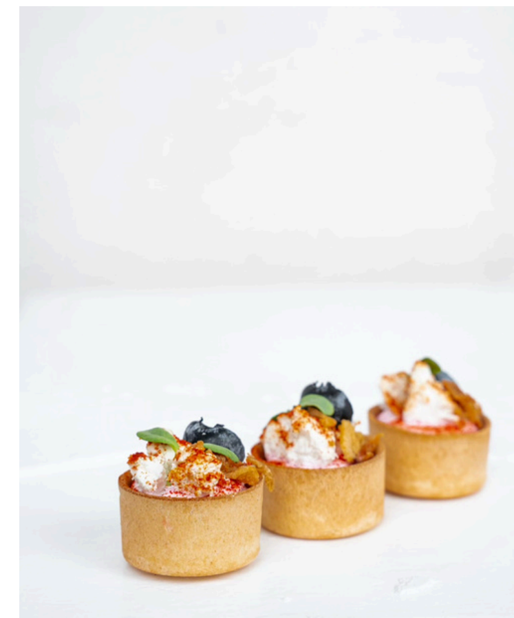
Tartaletė su rūkytų burokėlių kremu, ožkos sūriu ir svogūnų traškučiais