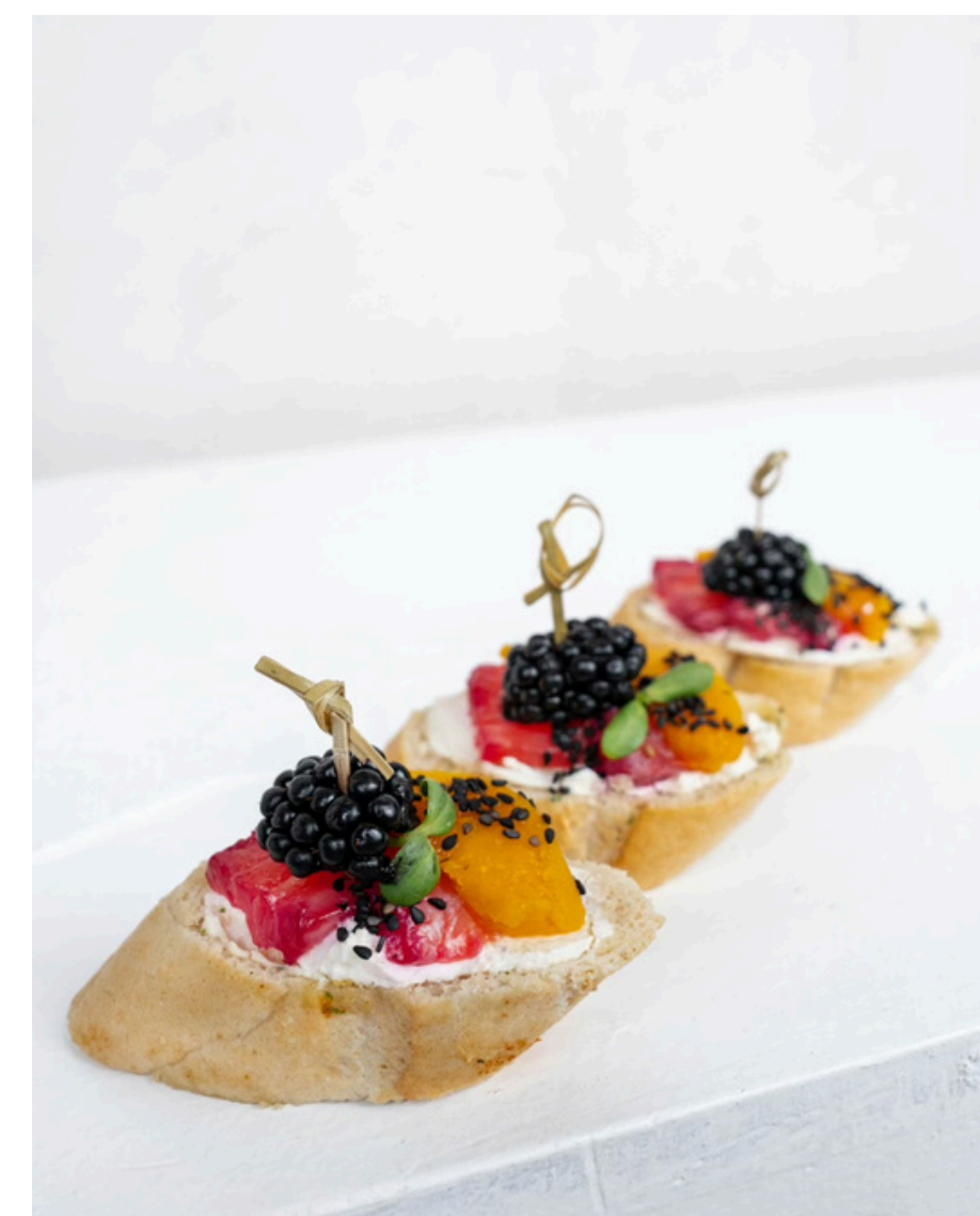
Brusketa su burokėlių sultyse marinuota lašiša ir persikais