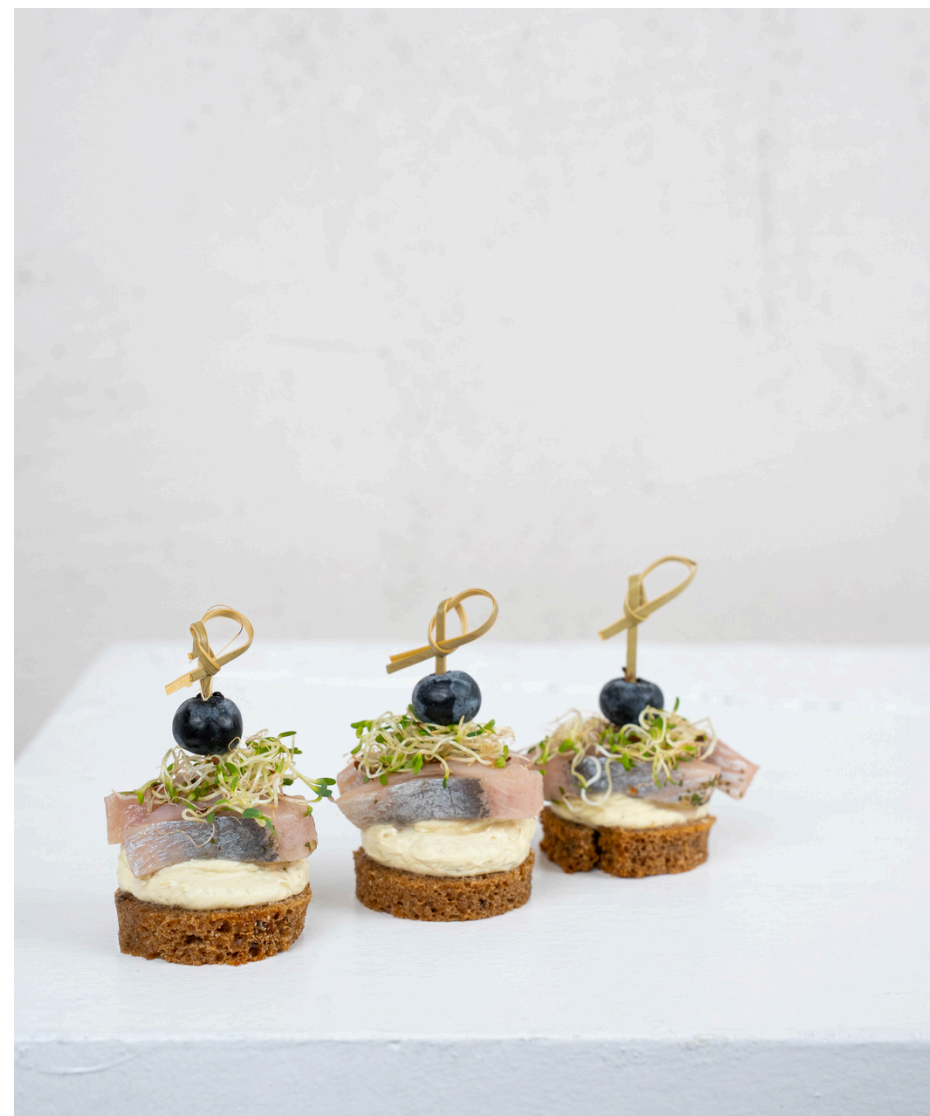
Juodos duonelės užkandis su silke, kreminiu pesto ir česnakų daigais 20 vnt - 25 Eur