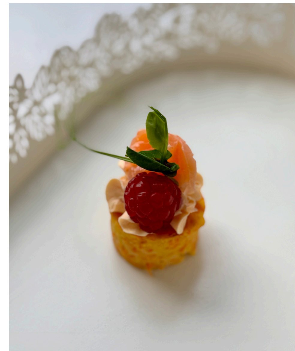
Morkų ir parmezano sūrio biskvitas su pomidorų užtepėle ir lašiša 20 vnt - 28 Eur