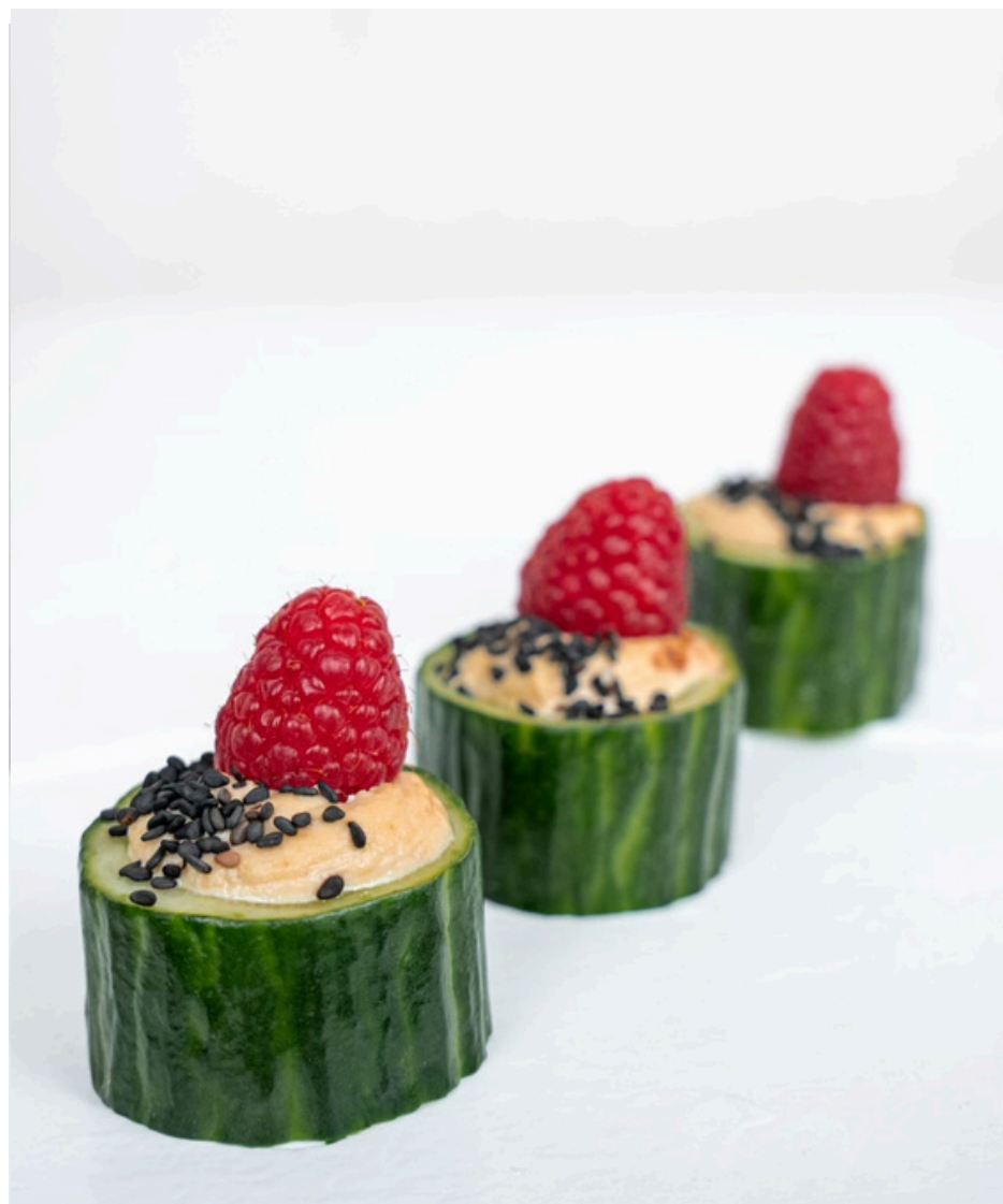
Šviežio agurko užkandis su naminiu pomidorais pagardintu humusu ir sėklomis