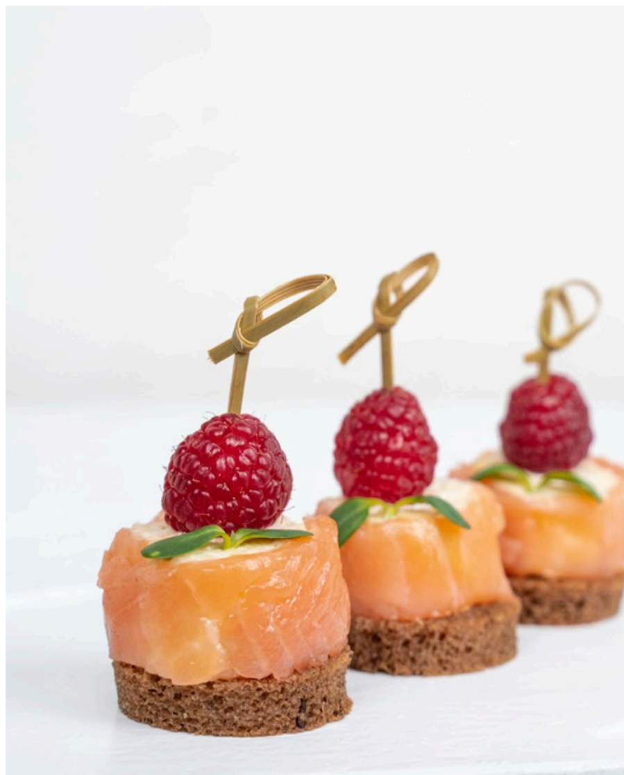
Juodos duonelės užkandis su lašišos ir parmezano sūrio suktinuku 20 vnt - 27 Eur