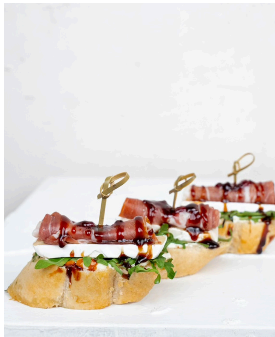
Brusketa su brie sūriu, pamos kumpiu ir balzamiko actu