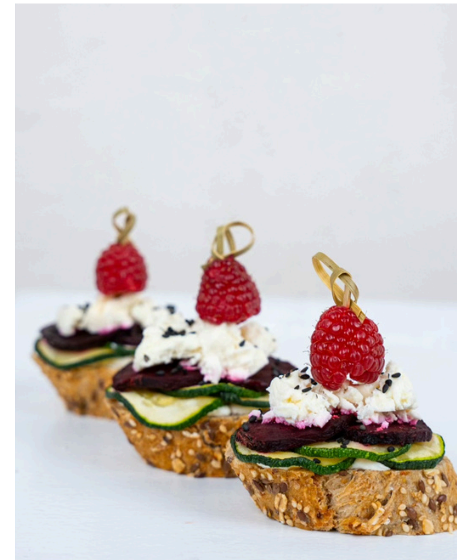
Brusketa su grill cukinija, burokėliais ir feta sūriu