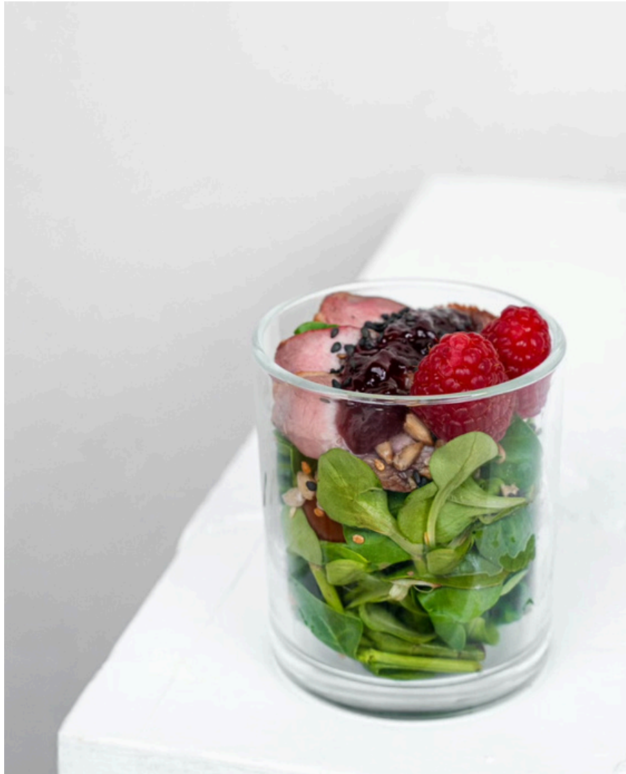
Šviežių daržovių salotos su antienos filė, bazilikų padažu ir bruknių džemu