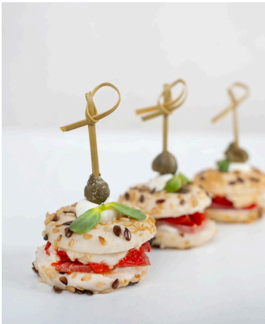
Mini beigelis su jautienos pastrami ir sūrio užtepėle