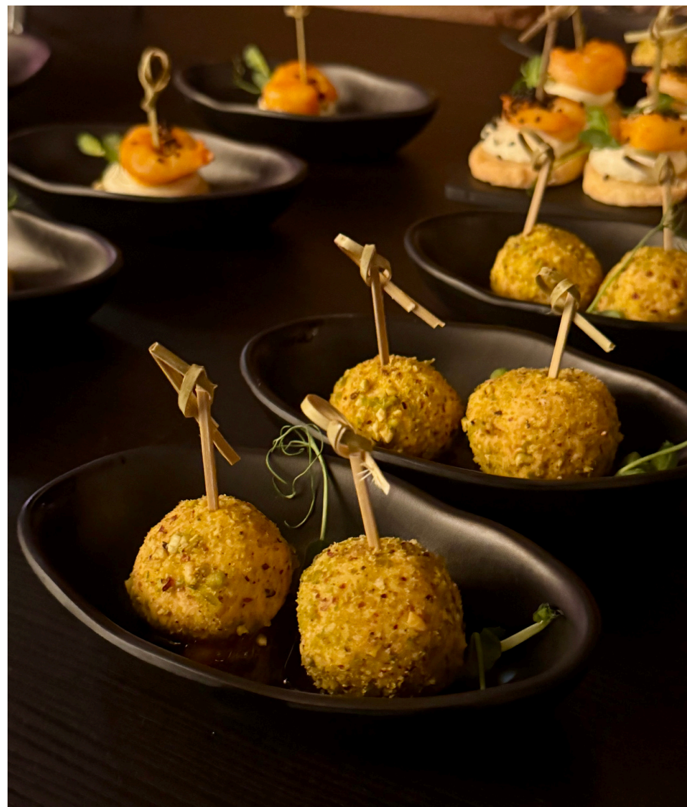
Pikantiškas sūrio ir rūkytos vištienos užkandis patiekiamas šaukštelyje 20 vnt - 27 Eur