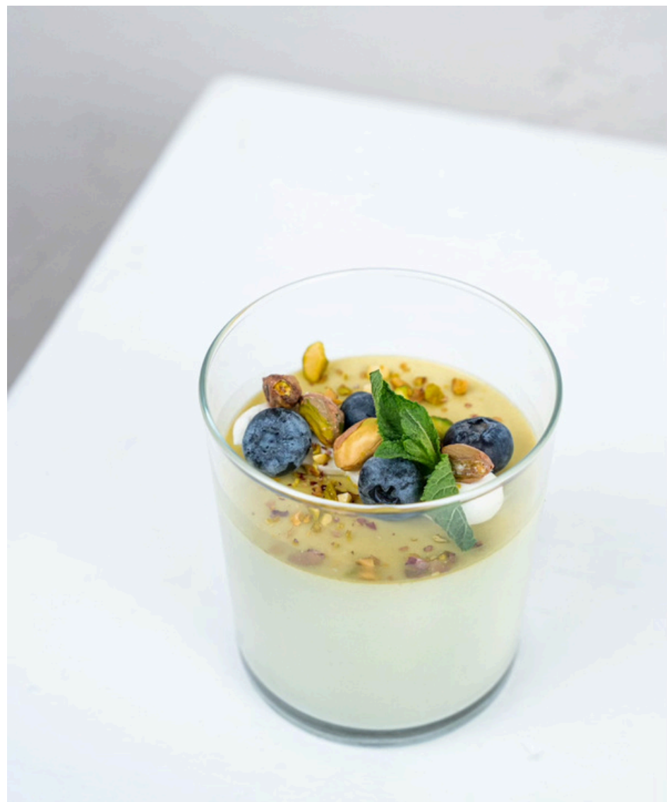
Pistacijų panna cotta su riešutais