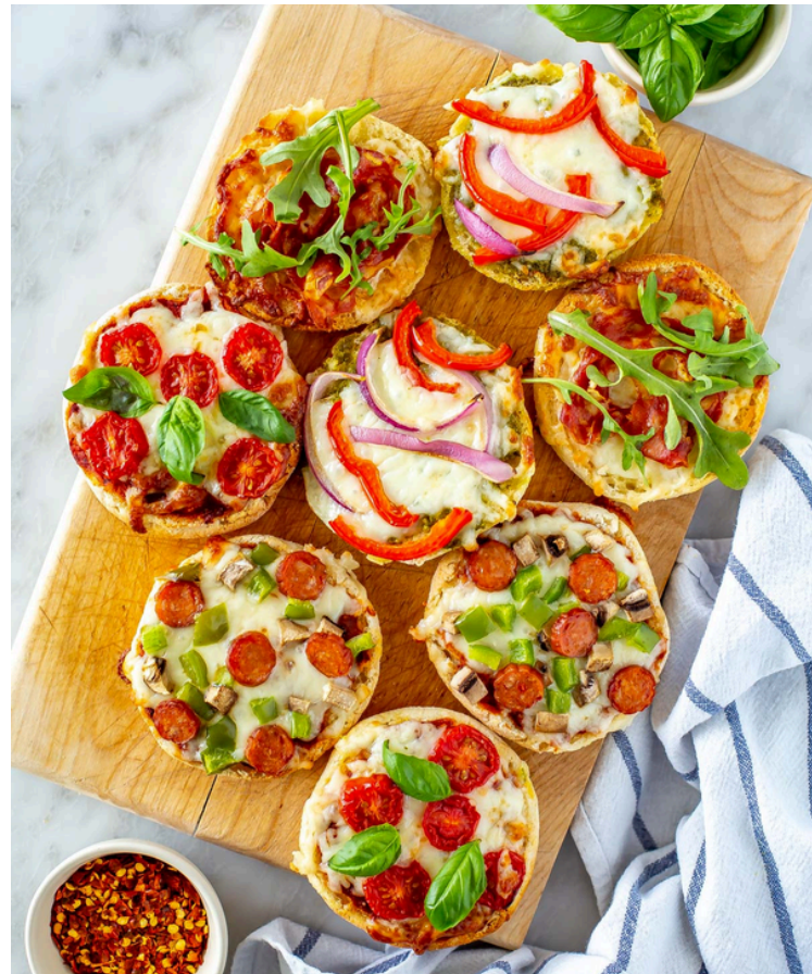
Mini pica su kumpiu ir sūriu