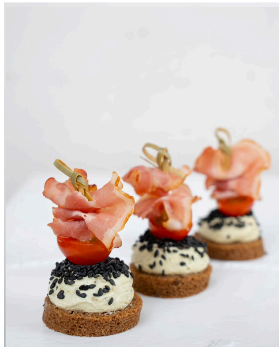
Juodos duonelės užkandis su šonine ir mini pomidoriukais