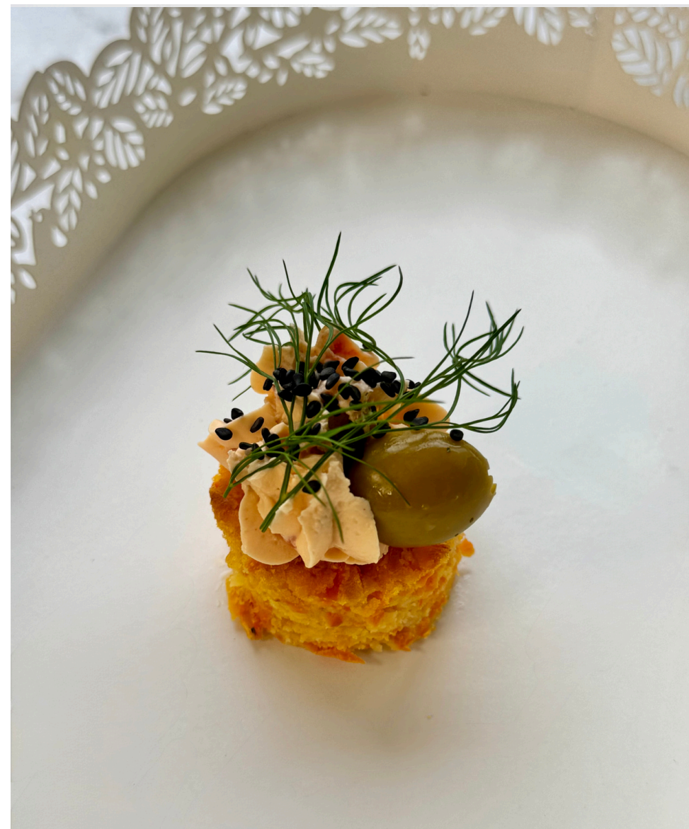
Morkų ir parmezano sūrio biskvitas su pomidorų užtepėle ir vištiena 20 vnt - 28 Eur