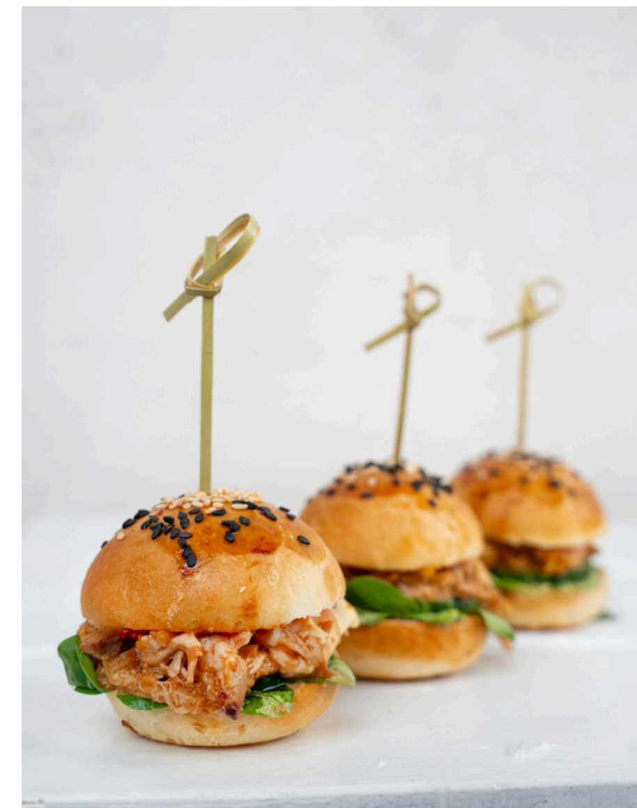
MINI burgeris su plėšyta BBQ kauliena 16 vnt - 28 Eurai