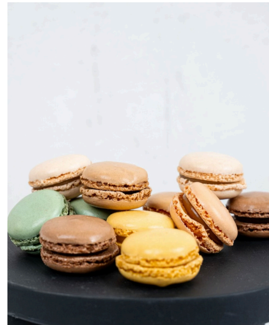
Macarons sausainiai įvairių skonių