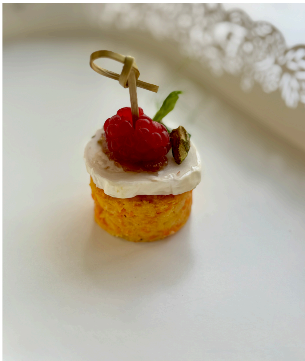
Morkų ir parmezano sūrio biskvitas su ožkos sūriu 20 vnt - 28 Eur