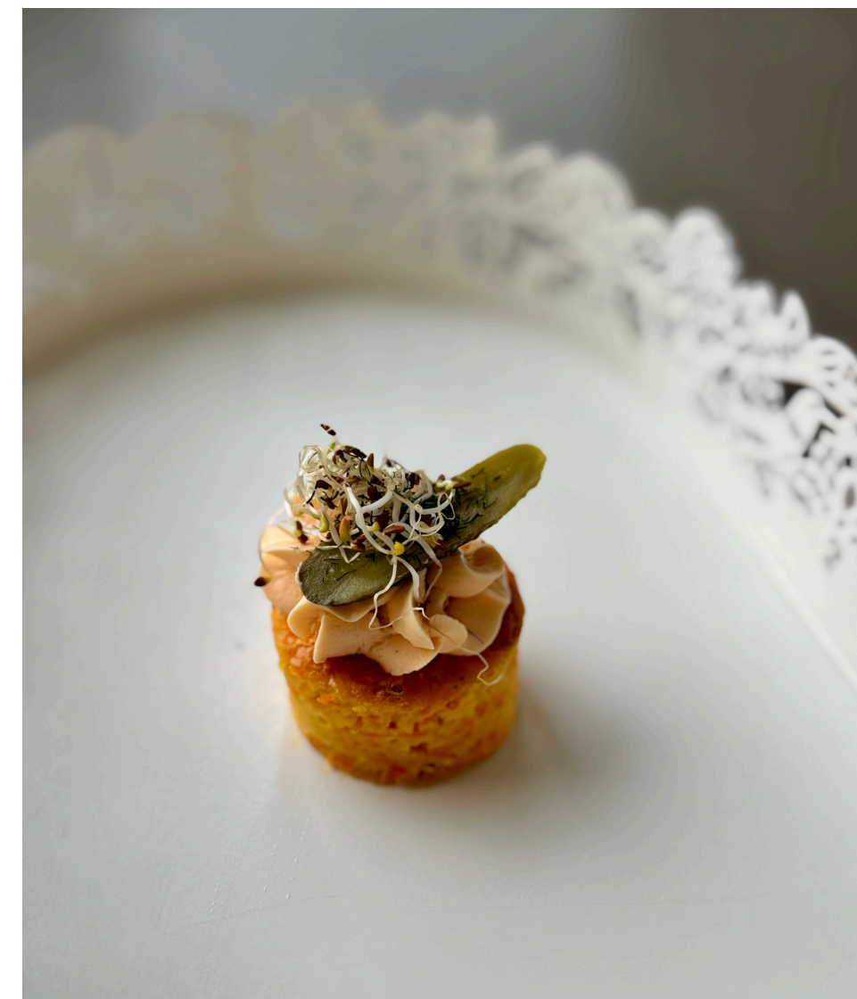
Morkų ir parmezano sūrio biskvitas su pomidorų užtepėle