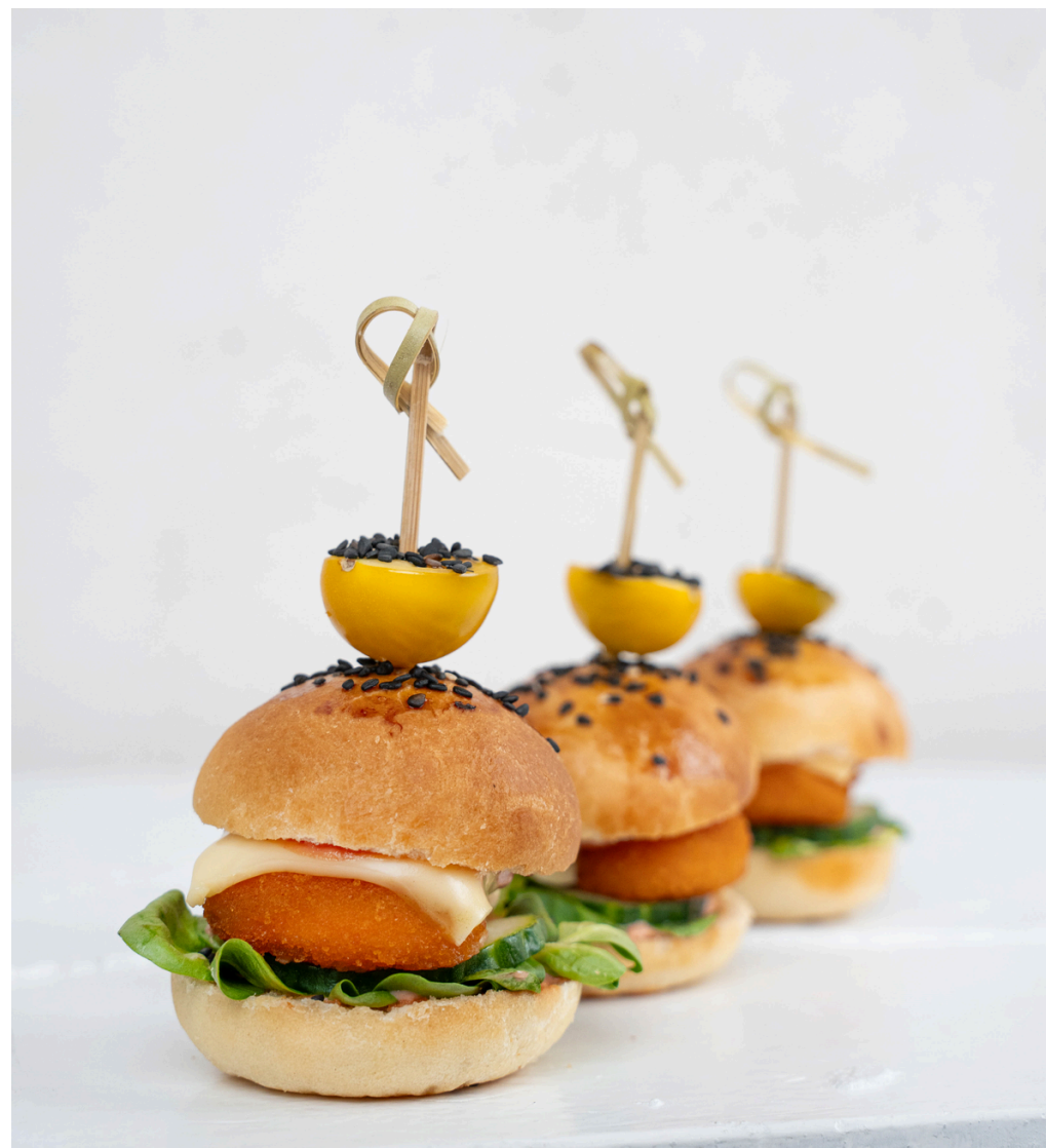
MINI burgeris su vištienos nuggets ir čederio sūriu 16 vnt - 28 Eurai