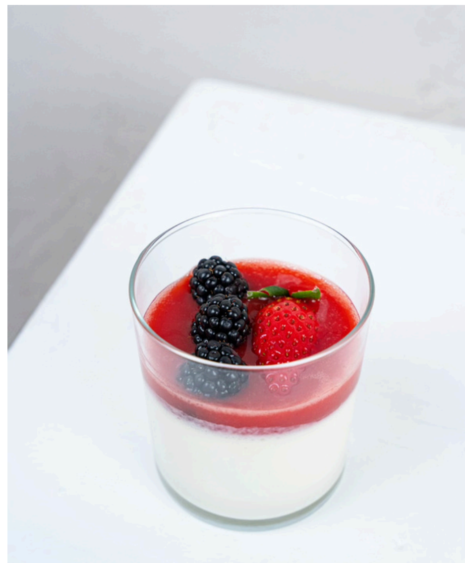
Klasikinė panna cotta su trintomis uogomis