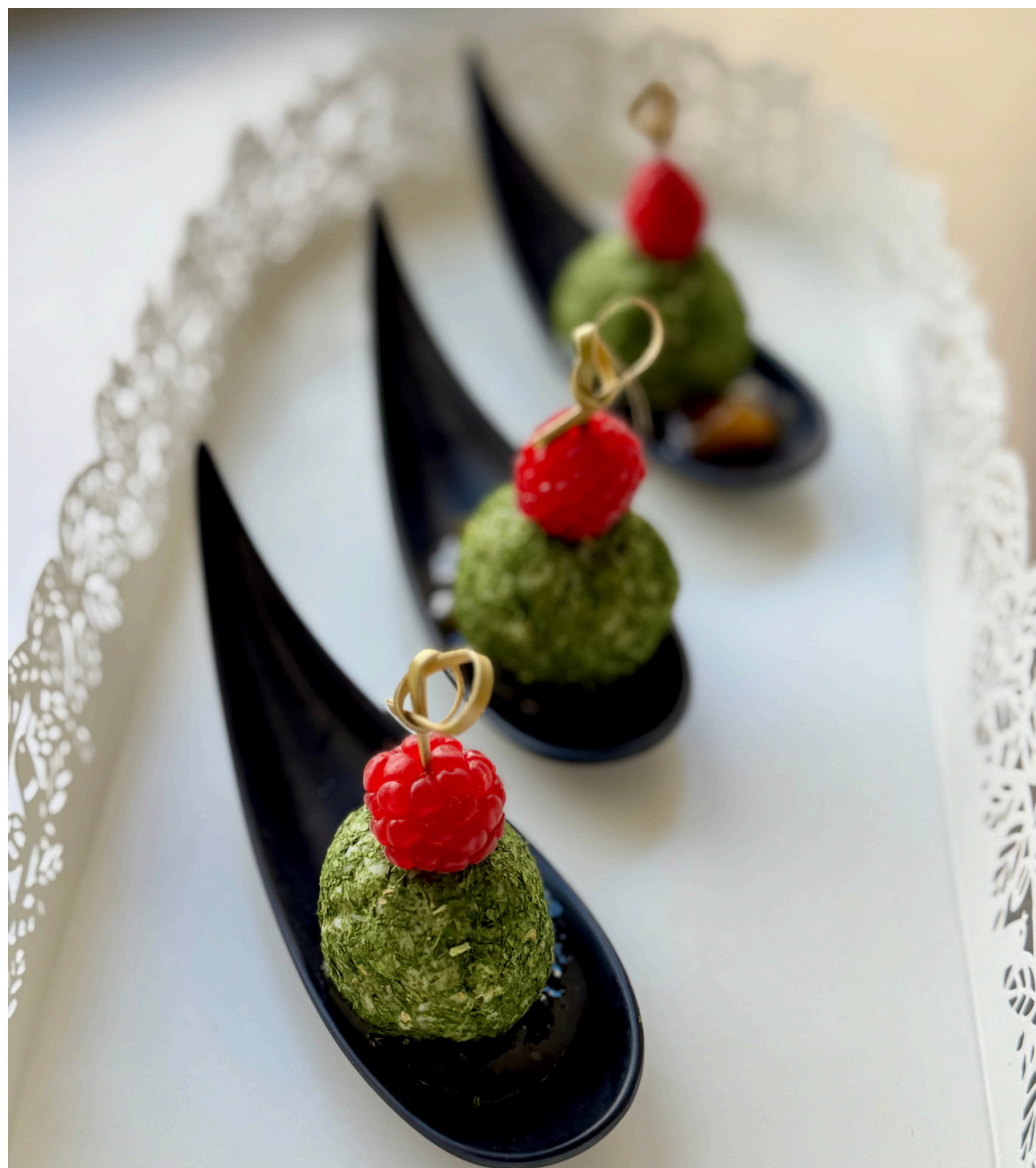
Triju sūrių užkandis su mango čutniu patiekiamas šaukštelyje 20 vnt - 27 Eur