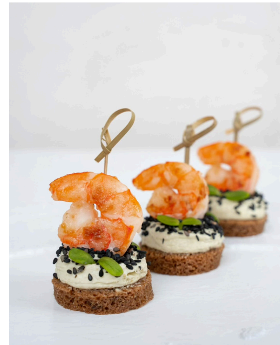
Juodos duonelės užkandis su kietojo sūrio kremu ir čili krevete 20 vnt - 28 Eur