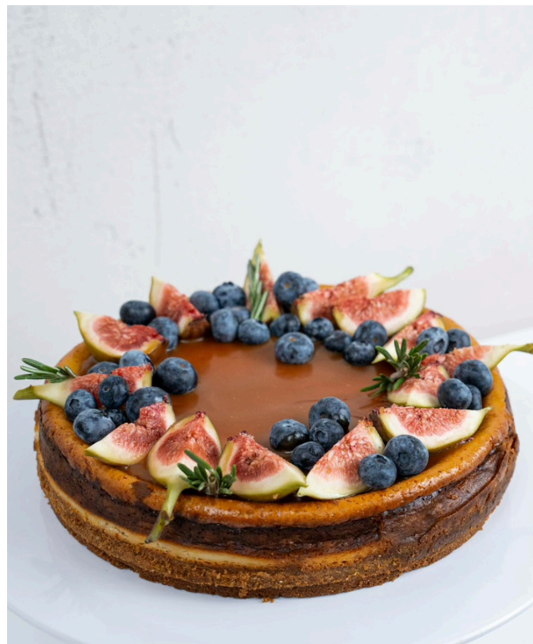
New York sūrio pyragas su namine sūria karamele ~ 1,5 kg 1 kg - 28 Eur