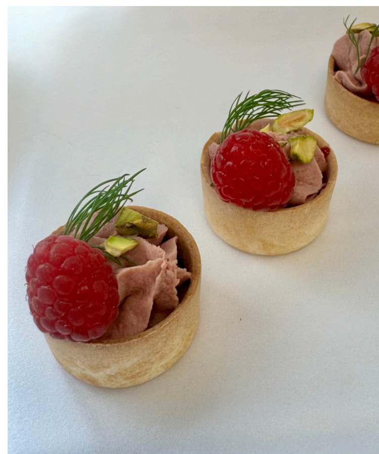
Tartaletė su džemu ir anties kepenėlių paštetu