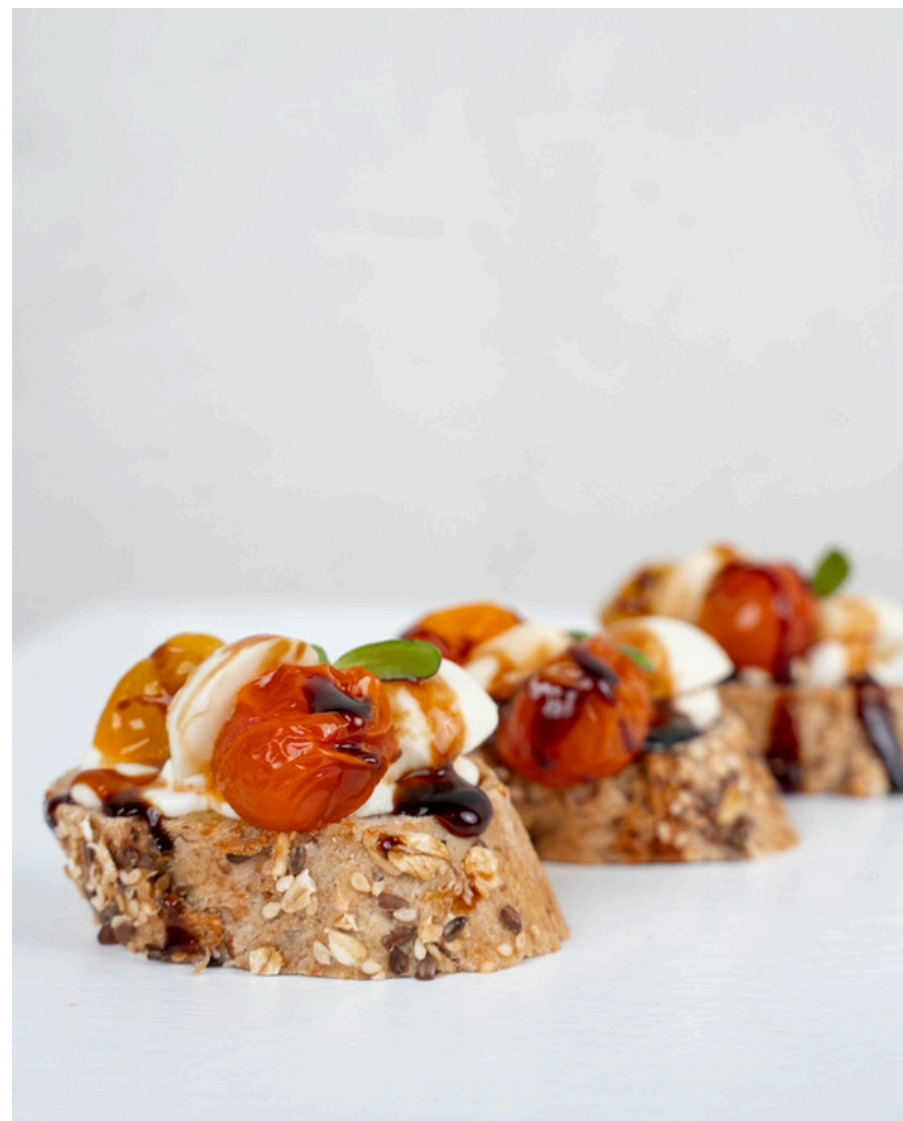
Brusketa su keptais vyšniniais pomidoriukais ir mocarela